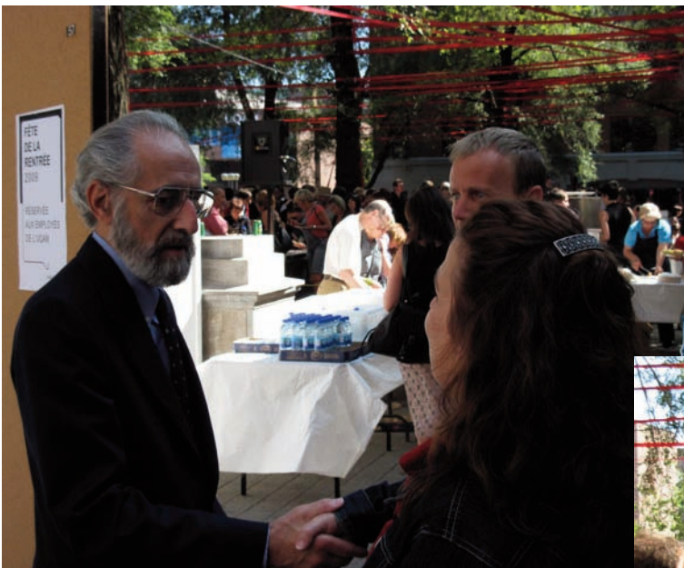
Le recteur, Claude Corbo, accueille les membres de la communauté universitaire