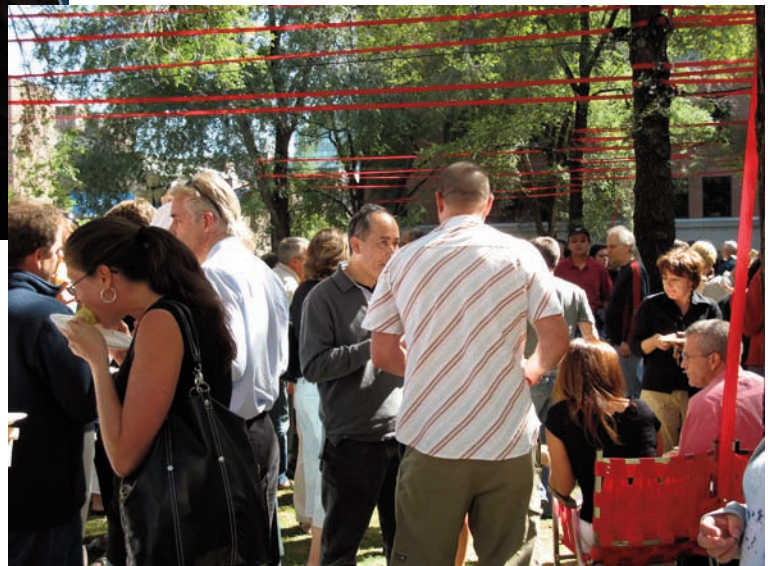
La foule festive...